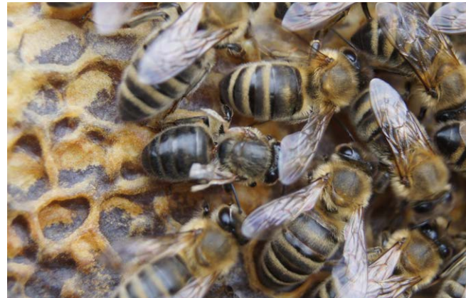
Durch Varroabefall und das Deformed-Wing-Virus stark geschädigte Arbeiterin.