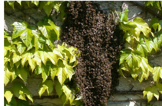
„Geteiltes Leid ist halbes Leid“ – beim Schwärmen teilen sich nicht nur Brut und Bienen, sondern auch die Milbenpopulation.

Durch die frühzeitige Befallssenkung im Sommer können die Winterbienen gesund aufwachsen und Winterverluste vermieden werden. Sofern die biotechnischen Maßnahmen effizient durchgeführt wurden und der externe Milbendruck gering ist, kann in der Regel ganz auf den Einsatz von Medikamenten im Herbst und Winter verzichtet werden. Hierzu muss man sich allerdings durch Befallskontrollen zwischen August und Oktober vergewissern, dass der Befall unterhalb bestimmter Grenzwerte liegt (s. Tab. S. 6).