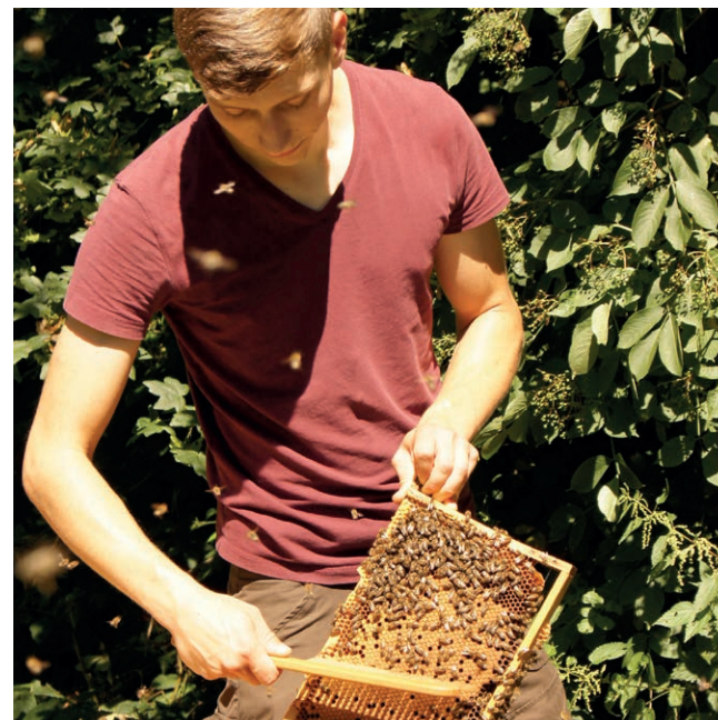
Abfegen der Bienen.

In der nebenstehenden Abbildung wird der Anstieg der Milbenzahl in einem nicht geschwärmten, unbehandelten Volk gut ersichtlich. Die steigende Zahl der Milben bei gleichzeitig abnehmender Brutaktivität der Bienen sorgt dafür, dass die verbleibende Brut im Spätsommer immer stärker parasitiert wird. Die typische zweigipflige Brutkurve der behandelten Völker verdeutlicht hingegen die Auswirkungen einer Brutpause, wie sie z. B. im Zuge des Schwärmens auftritt. Die Bienen gehen nach der Unterbrechung rasch wieder in Brut, während die Milbenpopulation langfristig geschädigt ist. Im Vergleich zu den unbehandelten, ungeschwärmten Völkern ist die Milbenanzahl deutlich reduziert.